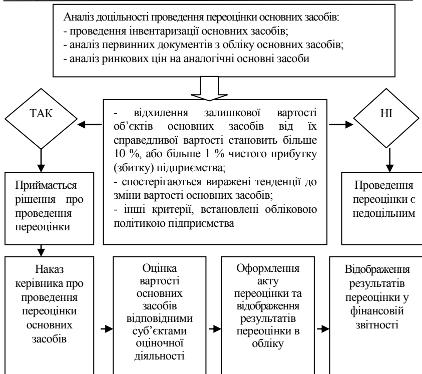
Рис. 1. Алгоритм проведення переоцінки основних засобів

Отже, після того, як було прийнято рішення про проведення переоцінки основних засобів (групи основних засобів), обов'язково видається наказ керівника про проведення переоцінки. В наказі повинна бути відображена така інформація: дата проведення переоцінки, перелік об'єктів переоцінки, основні характеристики об'єктів переоцінки (вартість, дата введення в експлуатацію, інвентарні номери тощо), відповідальні особи.